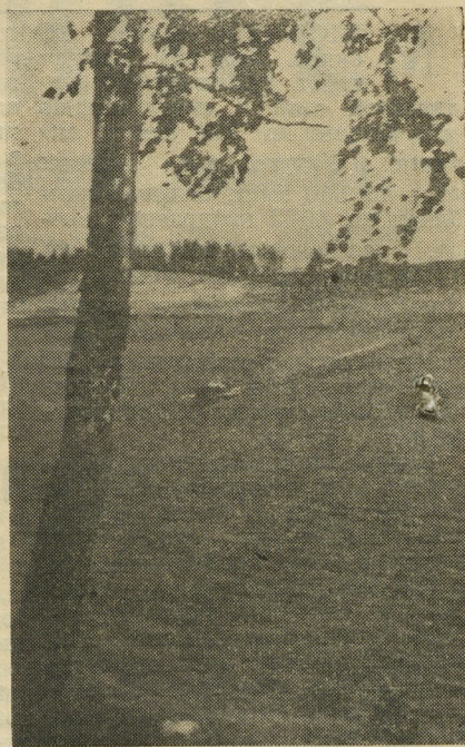
Свердловское море. Район станции Флюс.