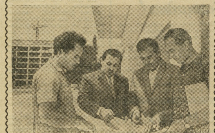
АБХАЗСКАЯ АССР. Все шире развертываются работы на строительстве курорта Пицунда. Возводятся корпуса 14-этажных зданий гостиниц-пансионатов, морской вокзал, курзал, ресторан и столовые, летний театр, закрытый плавательный бассейн.

Строительство всего комплекса курорта намечено завершить к концу 1965 года. Одновременно здесь смогут отдыхать более 4 400 человек.