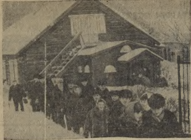
Татарская АССР. Дом-музей В. И. Ленина в деревне Кокушкино ежегодно посещает 60-70 тысяч человек. Здесь в 1887-88 годах Владимир Ильич отбывал наказание за свое первое революционное выступление — участие в студенческой сходке.

Со всех концов нашей страны, из зарубежных государств приезжают сюда экскурсанты.