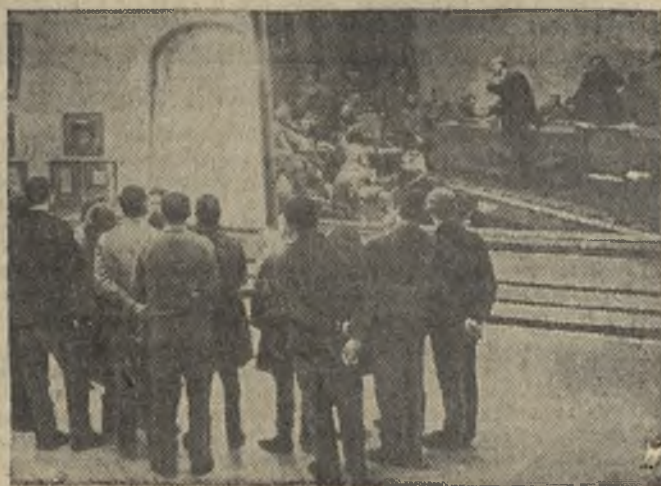
В Центральном музее В. И. Ленина.