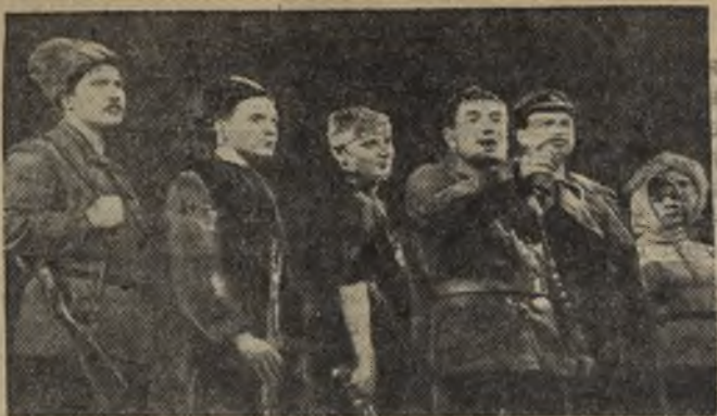
В Московском академическом театре имени В. Маяковского состоялась премьера спектакля «Разгром», поставленного по одноименному роману А. Фадеева.

БЕЗ РАБОТЫ оказались еще 1.100 рабочих одной из крупнейших американских авиакомпаний «Нэшнл Эйрлайнс». Под предлогом «экономических трудностей» администрация объявила об их увольнении.