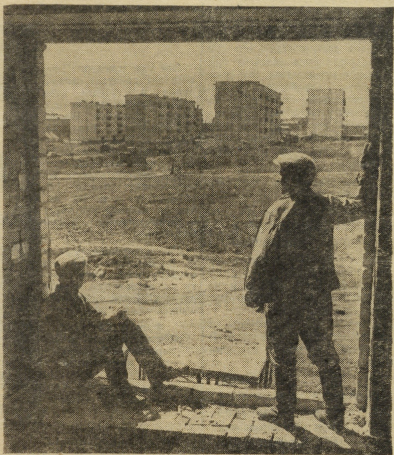
Вернулись солдаты к своей профессии каменщиков.

После торжественной части состоялся концерт художественной самодеятельности. Он был дан силами коллектива ансамбля Уральского военного округа.