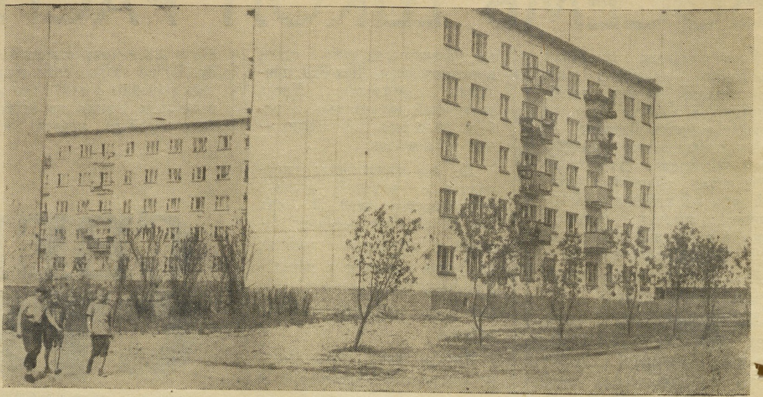
Новые дома в 21 квартале Вторчермета.