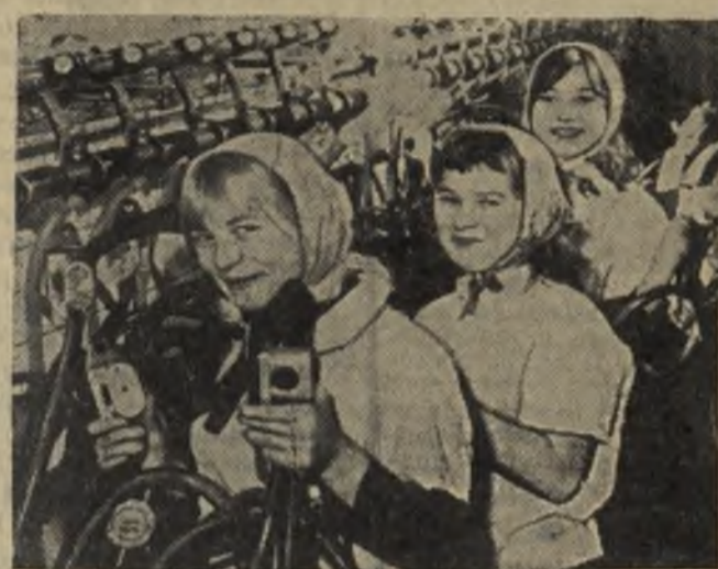
Молодые животноводы народного имени в Эберсбахе-Ш.окхаузине (д.г.). От каждой из обслуживаемых молодежной бригадой 200 коров за год получают по 5200 килограммов молока.