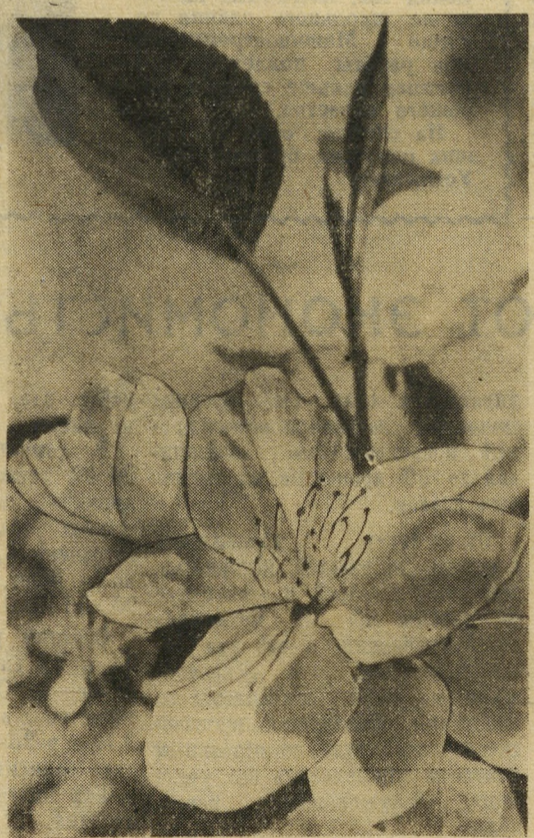
Цветет яблоня.