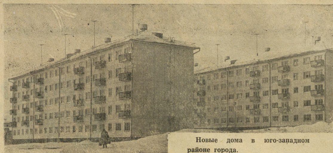
Новые дома в юго-западном районе города.