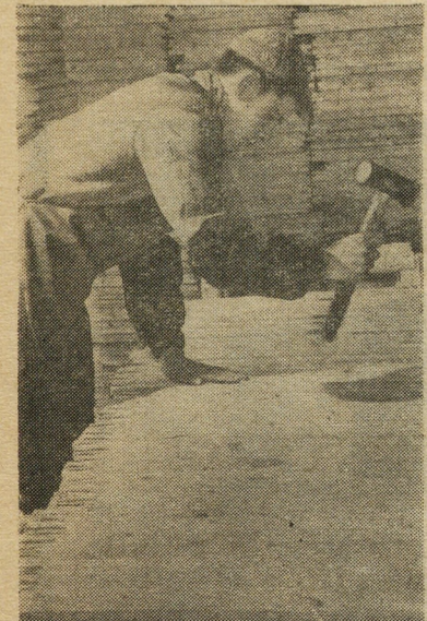
СВЕРДЛОВСКИЙ СТРОИТЕЛЬ 2 стр. 30 июня 1962 г.