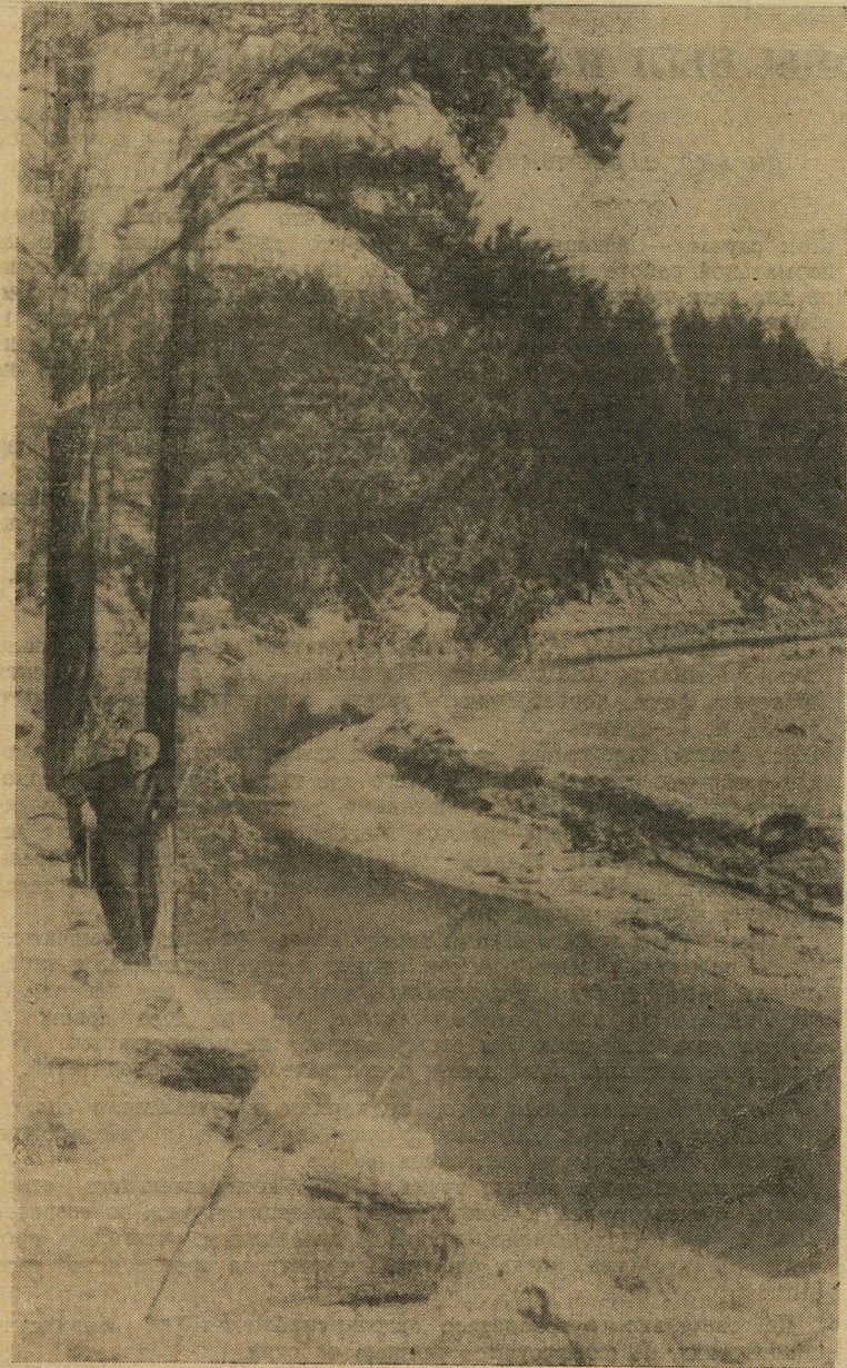
В окрестностях Свердловска.