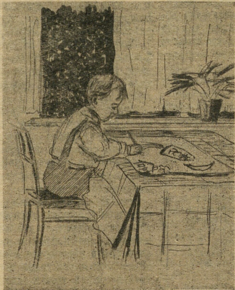
Любимая тема юного художника.