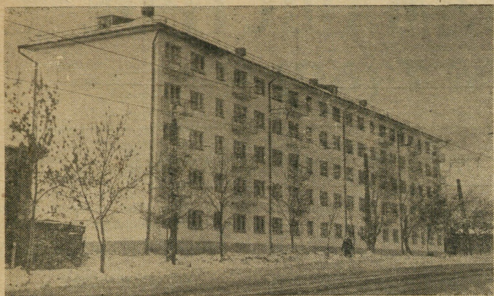
Новый 80-квартирный жилой дом, построенный коллективом 15 управления из крупных блоков в квартале «А» по улице Шевченко. В конце декабря он был сдан в эксплуатацию.