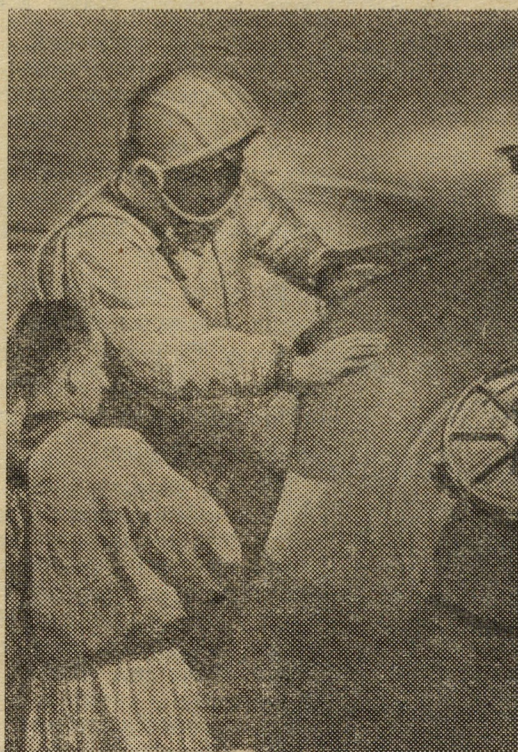
Летчик-космонавт майор Герман Степанович Титов на тренировке перед полетом в космос на корабле «Восток-2».