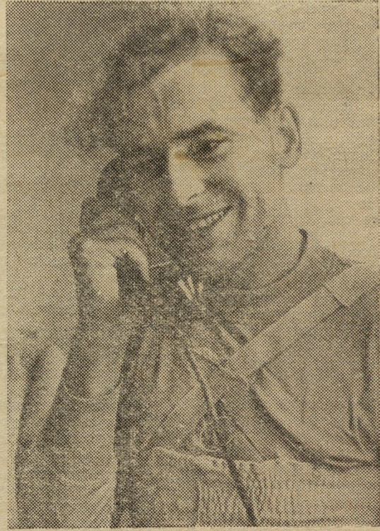
Майор Г. С. Титов разговаривает по телефону с Н. С. Хрущевым вскоре после успешного завершения своего космического полета.