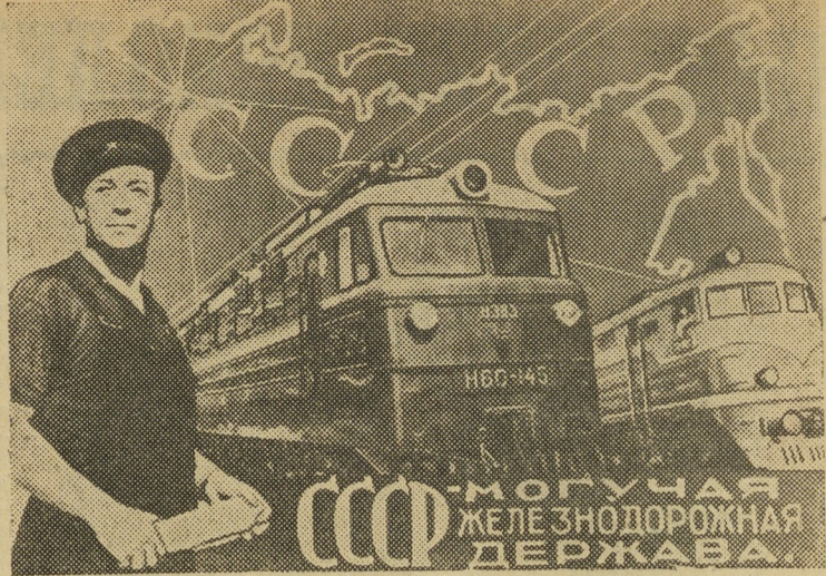
Фотомонтаж Б. Антонова.