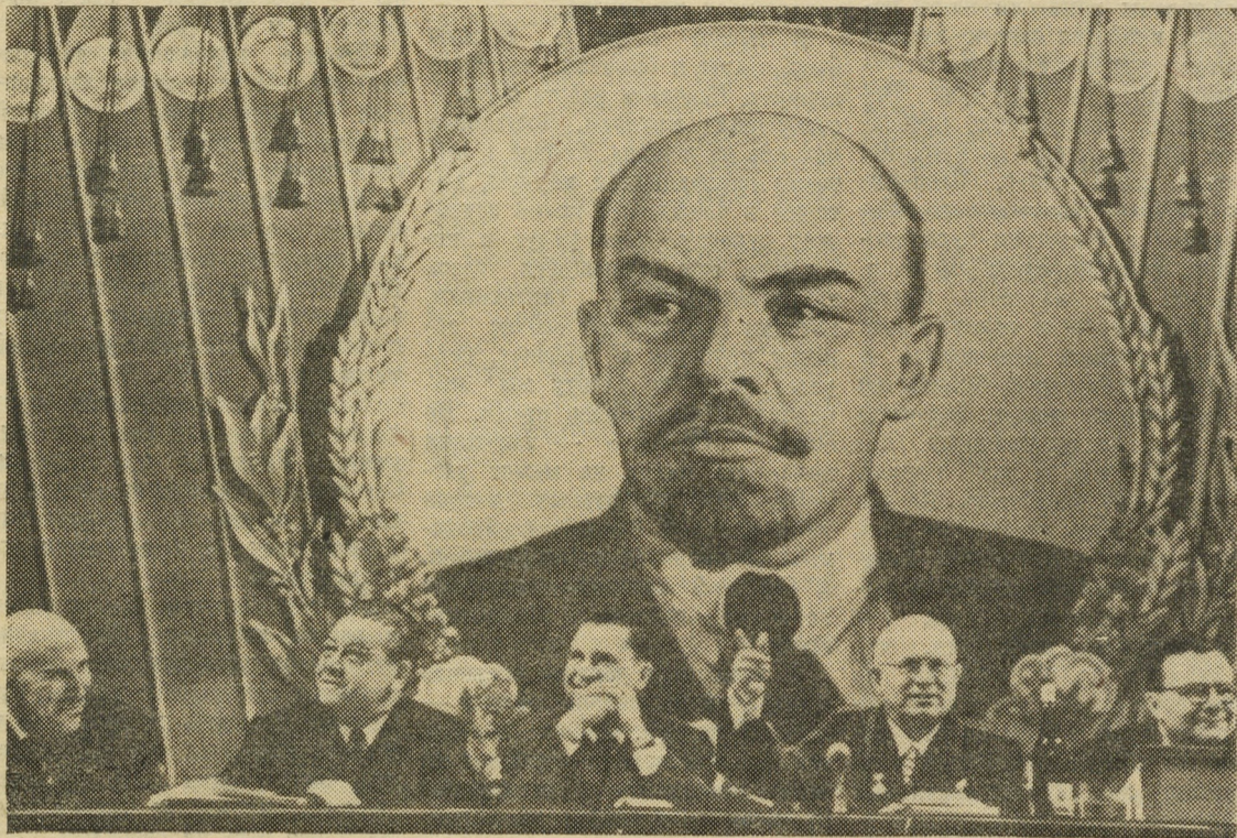
В ПРЕЗИДИУМЕ СОВЕЩАНИЯ