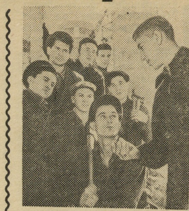
ГАЗОПРОВОД ДЖАРКАК — ТАШКЕНТ В СТРОЮ

Намного укрепилась и дисциплина в бригаде. За нею внимательно следит сам коллектив, так что мне, бригадир, иной раз