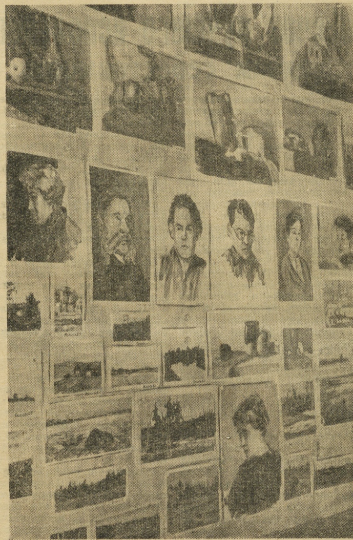
Фото и текст Г. Богатнаева.

Много ценных советов дал студийцам посетивший выставку свердловский художник Бурак. Ряд работ он отобрал на предварительный просмотр к предстоящей областной выставке самодеятельных художников, которая скоро откроется в Свердловске.