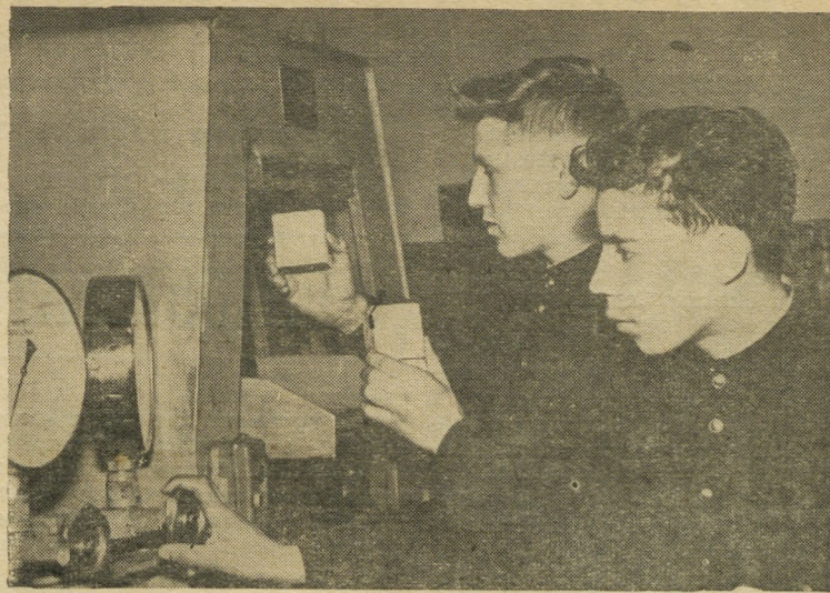
В строительном училище № 18 будущие каменщики, монтажники, штукатуры, плотники изучают свойства строительных материалов.