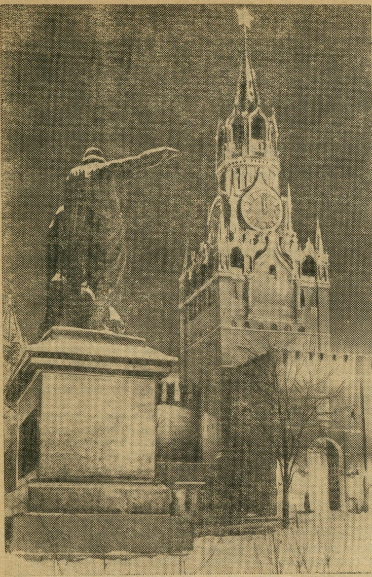
Москва. Спасская башня Кремля ночью.

Сегодня исполняется 70 лет со дня рождения выдающегося чехословацкого писателя Карела Чапека. Тонкий юморист и беспощадный сатирик, Чапек показывал в своих произведениях неустойчивость современного капиталистического общества. В сердце Чапека жила большая любовь к человеку. Он был активным антифашистом.