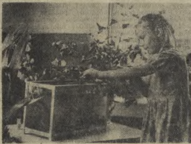
В районном конкурсе на лучшее сельское дошкольное учреждение первое место присуждено Ощепковскому детскому саду совхоза «Глинский». На снимке: в живом уголке детсада.