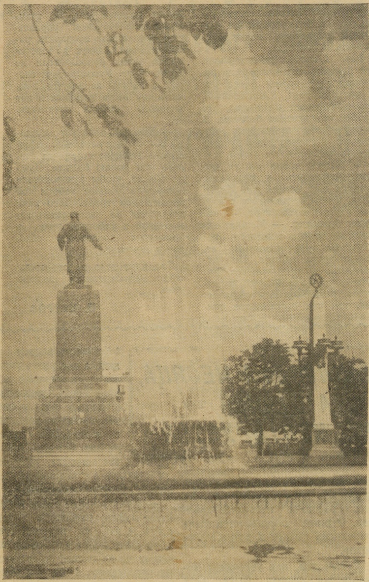
УЗТМ. Памятник Серго Орджоникидзе.