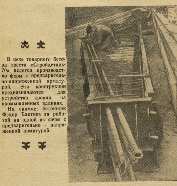
В цехе товарного бетона треста «Стройдеталь-70» ведется производство ферм с предварительной напряженной арматурой. Эти конструкции предназначаются для устройства кровли на промышленных зданиях.

В настоящее время простои ликвидированы.