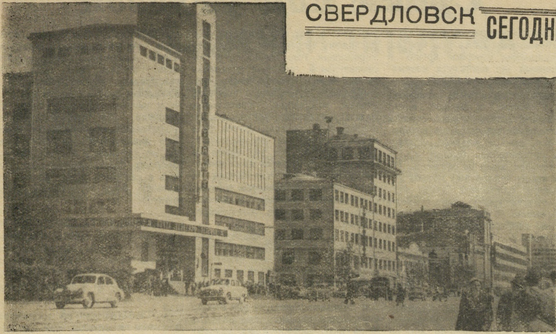
Центральная магистраль города — улица Ленина.