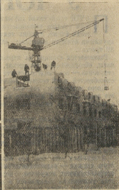
Новое здание возводится строительным управлением № 245 на улице Мичурина. Это жилой дом из 66 благоустроенных квартир с ванными, холодильными шкапами и газом.

26 ноября состоялось объединенное партийное собрание трестов № 89 и «Стройдеталь-70», где, в частности, обсуждалось положение с ходом реконструкции промпредприятий. Коммунисты потребовали от руководителей треста № 89 и стройуправлений № 234, 753 и 774 в кратчайшие