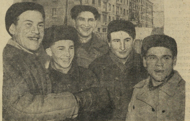
Меньше, чем за два месяца сложен этот 80-квартирный дом на Водопроводной улице.

Участники слета приняли обращение ко всем рабочим, колхозникам и интеллигенции Свердловской области, а также приветственное письмо ЦК КПСС.