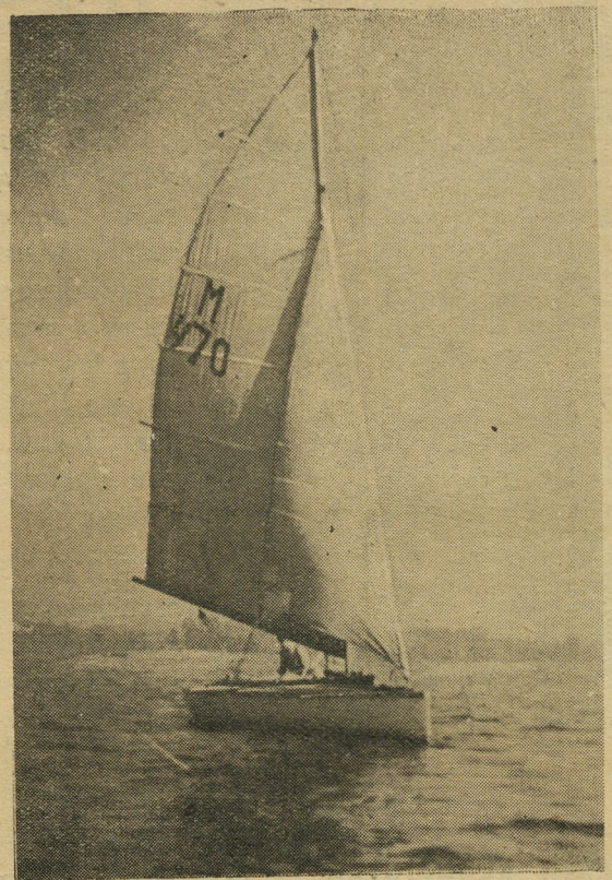
На Верх-Исетском пруду.