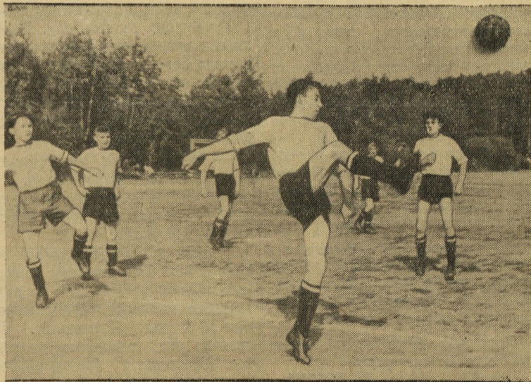
В парке культуры и отдыха в честь Дня строителя разыгрывался кубок по футболу.

На снимке: момент игры между командами стройтреста № 89 и завода железобетонных изделий.