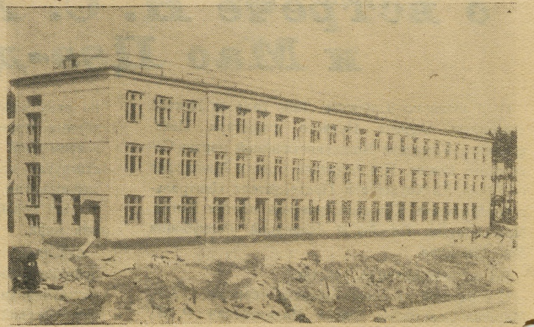
Хорошее школьное здание возвели строители 235 управления. Но, к сожалению, отделочные работы в нем ведутся плохо. Как видно на снимке, здесь сильно отстают и работы по благоустройству.