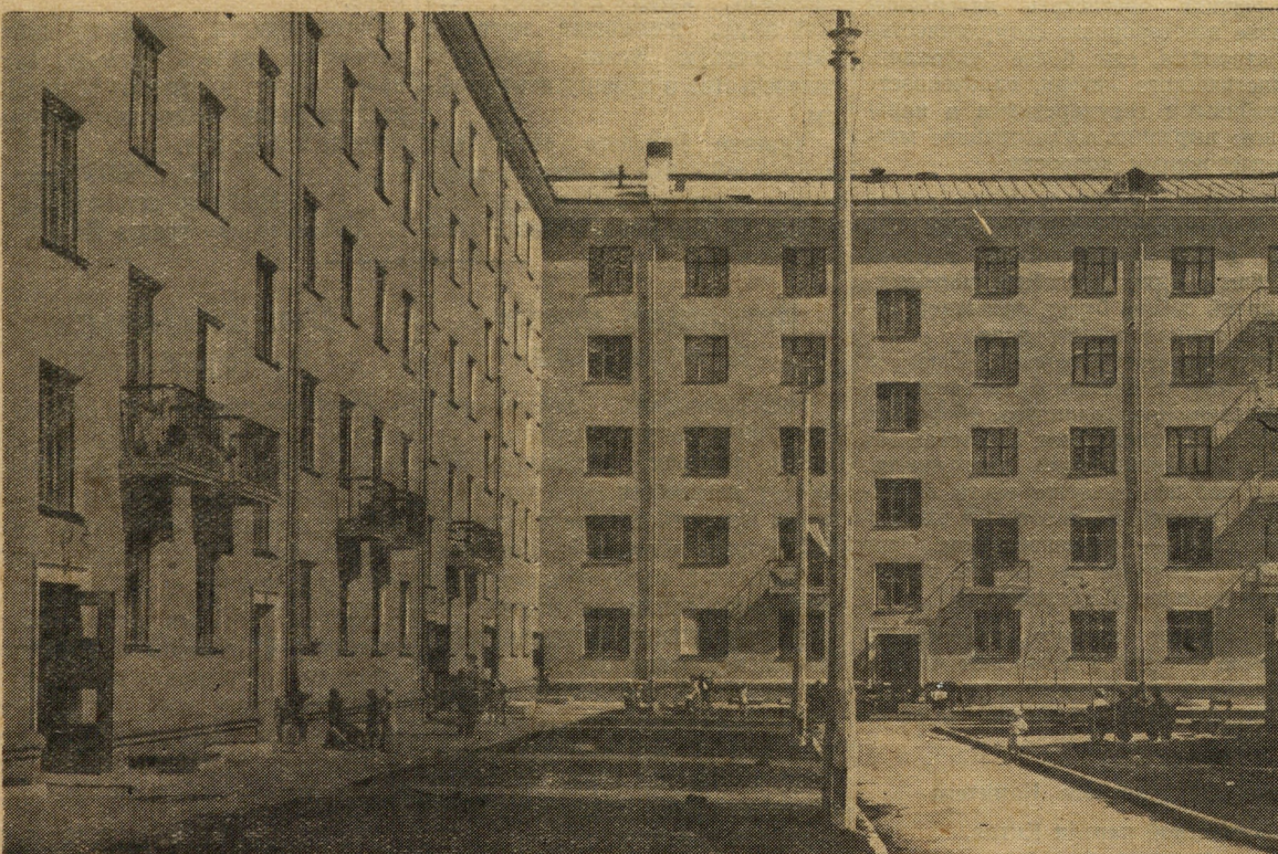
Этот 100-квартирный дом принят государственной комиссией с оценкой «отлично». Коллектив 752 управления треста № 89, который строил этот дом, теперь настойчиво борется за отличное качество работ на других объектах.

В. СТЕПАНЕНКО, секретарь парторганизации второго управления «Южгорстроя».