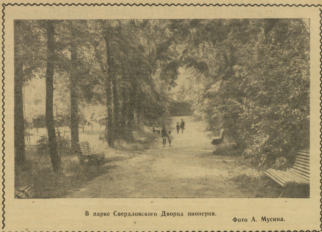
В парке Свердловского Дворца пионеров.