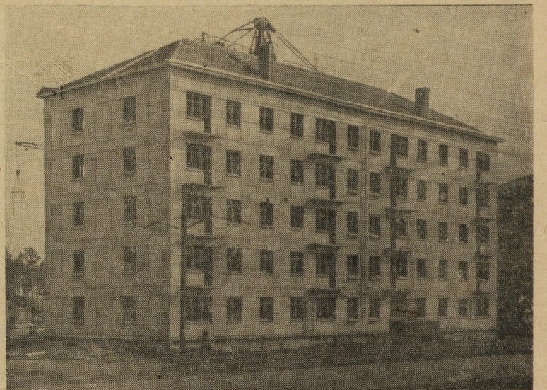
ИДЕТ внутренняя начинка дома № 11 в седьмом квартале. Это первое в Свердловске жилое здание, построенное из блоков двухрядной разрезки. Бригада монтажников 33 треста во главе с тов. Костыревым, которая монтировала дом, теперь устанавливает в нем перегородки. Скоро сюда придут отделочники.

Ф. РАДЬКО, начальник планового отдела завода.