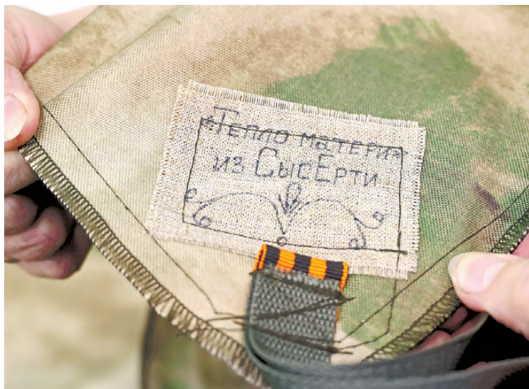
Каждое изделие мастерицы вручную отмечают особым знаком.

Доверие землячков, конечно, воодушевляет на новые трудовые подвиги, особенно перед Новым годом. Каждое отправляемое на фронт изделие помечено особым знаком: на крохотном бежевом отрезке ткани выведено карандашом «Тепло матери», рядом вишневые веточки, напоминающие веточки рябины. Лейбл придумали сами, делают его исключительно вручную, чтобы маленький кусочек символизировал сердечную связь между теми, кого разделяют тысячи километров.