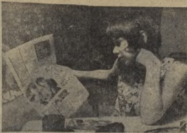
Пришла «Пионерская правда»...

ПРОДОЛЖАЮТСЯ столкновения жителей американского города Мадисон (штат Висконсин) с полицией и отрядами национальной гвардии, которые после прибытия подкреплений насчитывают более тысячи солдат. Около 450 человек, в основном студенты местного университета, провели демонстрацию протеста против сокращения ассигнований на социальные нужды.