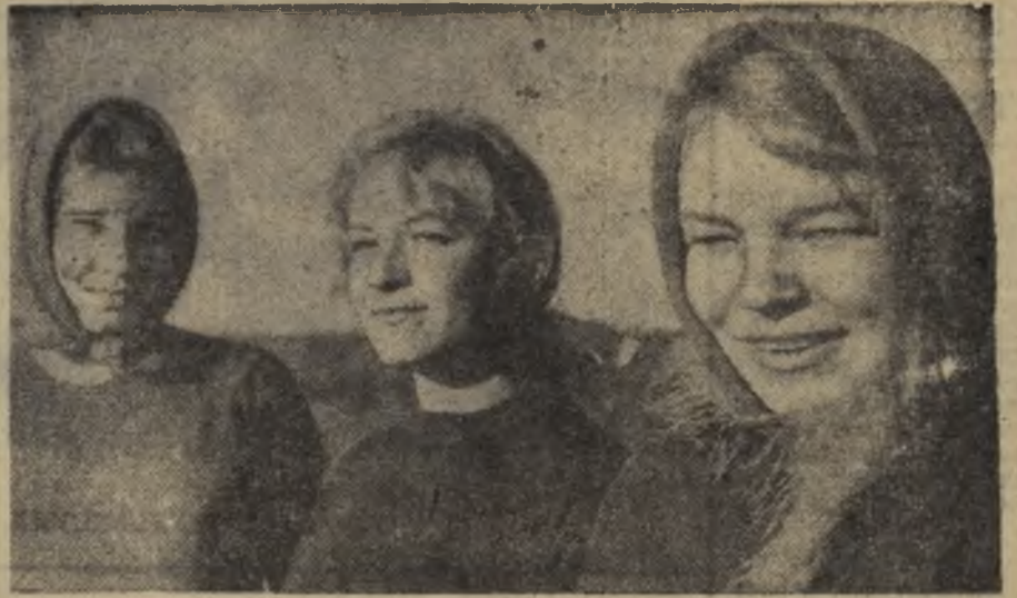
Коллектив второго отделения совхоза имени Ворошилова доволен своими помощниками — учащимися Нижне-Тагильского медпедического училища. Девуш-

ки хорошо поработали на уборке картофеля.