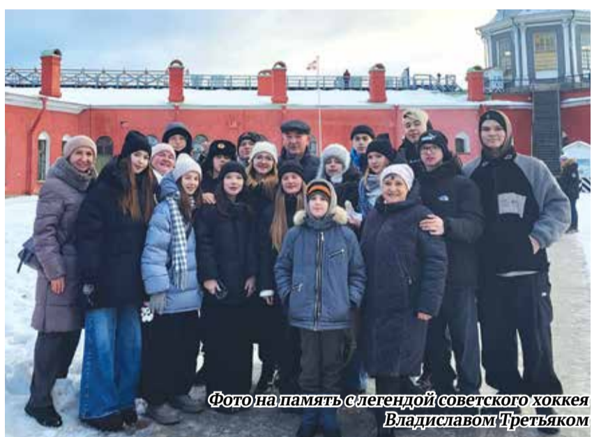
Фото на память легендарного советского хоккея Владиславом Третьяком

Санкт-Петербург было моей мечтой. И она осуществилась! Мы ездили на метро, гуляли по городу и были в восторге от красивых зданий, особенно вечером, когда повсюду включалась иллюминация. Много фотографировались. На конкурсе смогли выложиться и завоевать 3-е призовое место, что также нас очень обрадовало! Спасибо руководителю нашего коллектива за возможность посетить большие города, знакомится с их историей, восхищаться прекрасной архитектурой и побеждать. Мне все очень понравилось!».