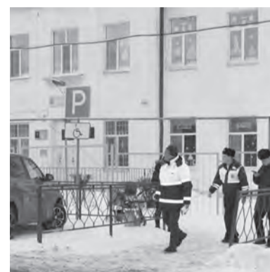
График работы почтовых отделений

В рамках встречи областному гостю озвучили ситуацию по ремонту дорог, обустройству тротуаров и школьных переходов вдоль маршрута «Дом-школа-дом» в этом году, сумму выделенных на эти цели средств. Рассказали о планах на 2024 год и провели экскурсию по городу.