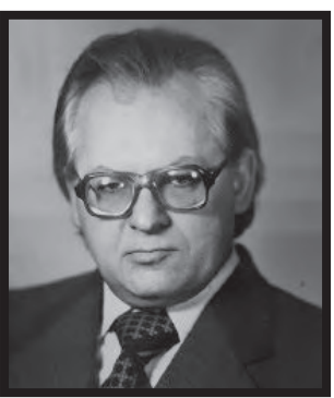
ЖЕНА, ДЕТИ, ВУНУКИ