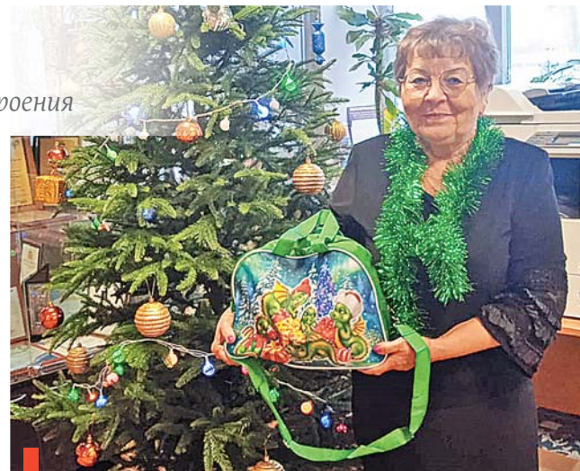
Один из трех с половиной сотен подарков

Я горда тем, что традиция с благотворительностью на нашем предприятии остается неизменной, несмотря на сложности, которые то и дело случаются (коронавирусные ограничения 2020 года, мероприятия второй по-