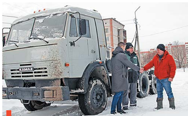
Передача КамАЗа от «ФОРЭС» суходоложскому техникуму

Компания «ФОРЭС» сделала предновогодний подарок Суходоложскому многопрофильному техникуму – КамАЗ выпуска 2006 года. Ходовые свойства автомобиля уже утратил, но подходит для изучения строения двигателя и других механизмов.