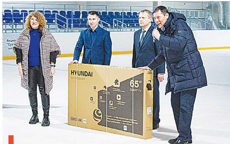
Вручение телевизора воспитанникам Филатовского социально-реабилитационного центра

После игровой программы ребята прошли по «Литейщику» с экскурсией, затем вдоволь покатались на коньках под руководством тренера.