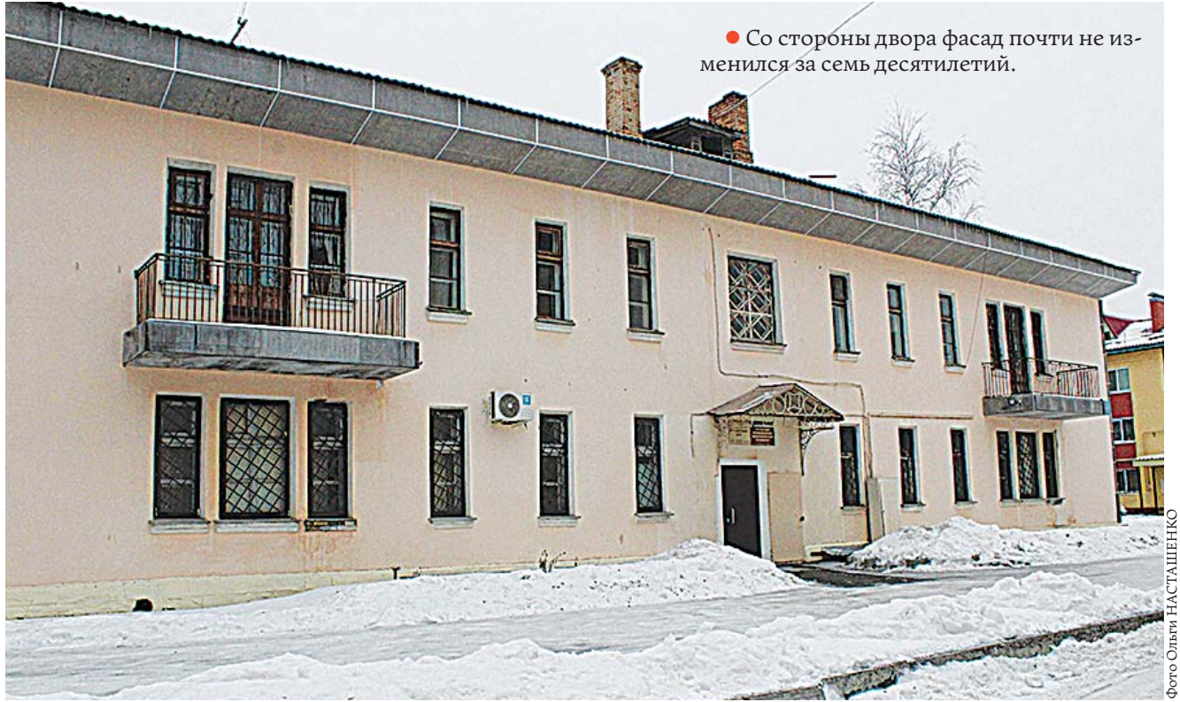
● Со стороны двора фасад почти не изменился за семь десятилетий.