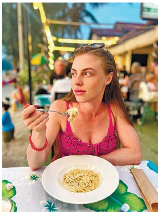
Хочется попробовать всё!