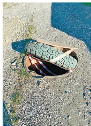
Такое сооружение было сделано в августе