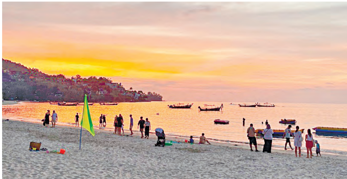
Третья по высоте статуя Будды в Таиланде

После змеиной фермы отправились к Большому Будде. Статуя находится на вершине холма Наккерд недалеко от Чалонга. Строительство началось в 2004 году, а к 2017 году 80 процентов проекта