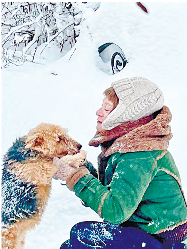
Собаки помогают нам жить и берут на себя нашу боль