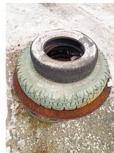
А эту конструкцию установили в ноябре

Они рядом, когда нам хорошо, и с нами, когда нам не до них, они чувствуют нас и помогают своим присутствием, они — младшие члены семьи и им, кроме нашей любви, к сожалению, достаётся ещё и энергетическая нагрузка рода. Видимо, поэтому наши домашние друзья иногда внезапно заболевают и трагически погибают.