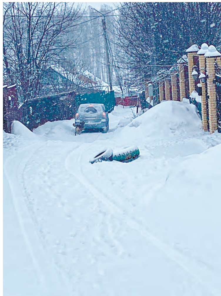
Улица с колодцем посреди дороги не интересует никого, кроме жителей этой улицы

Наши домашние питомцы — собаки и кошки, черепахи и шиншиллы, хомяки и попугаи нужны нам для радости, тепла, заботы и любви. Они помогают нам, людям, не черстветь душой, поддерживать милосердие в обществе.