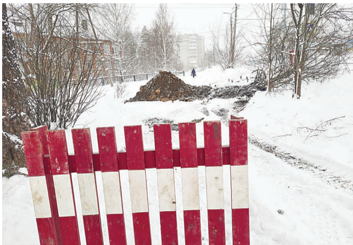
Коммунальные аварии в Качканаре происходят всё чаще

В декабре по мессенджерам начала распространяться заметка из газеты «Аргументы и факты. Урал» о том, что в большинстве городов Свердловской области рост коммунальный платежей будет ограничен предельным индексом 9,8%. А исключением станет Качканар, где реализуется инвестиционный проект в сфере ЖКХ, и депутаты попросили поднять тарифы для населения.