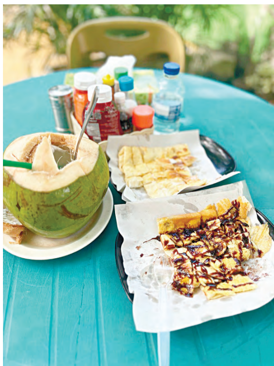
Вкусные в Таиланде блинчики, но дома вкуснее