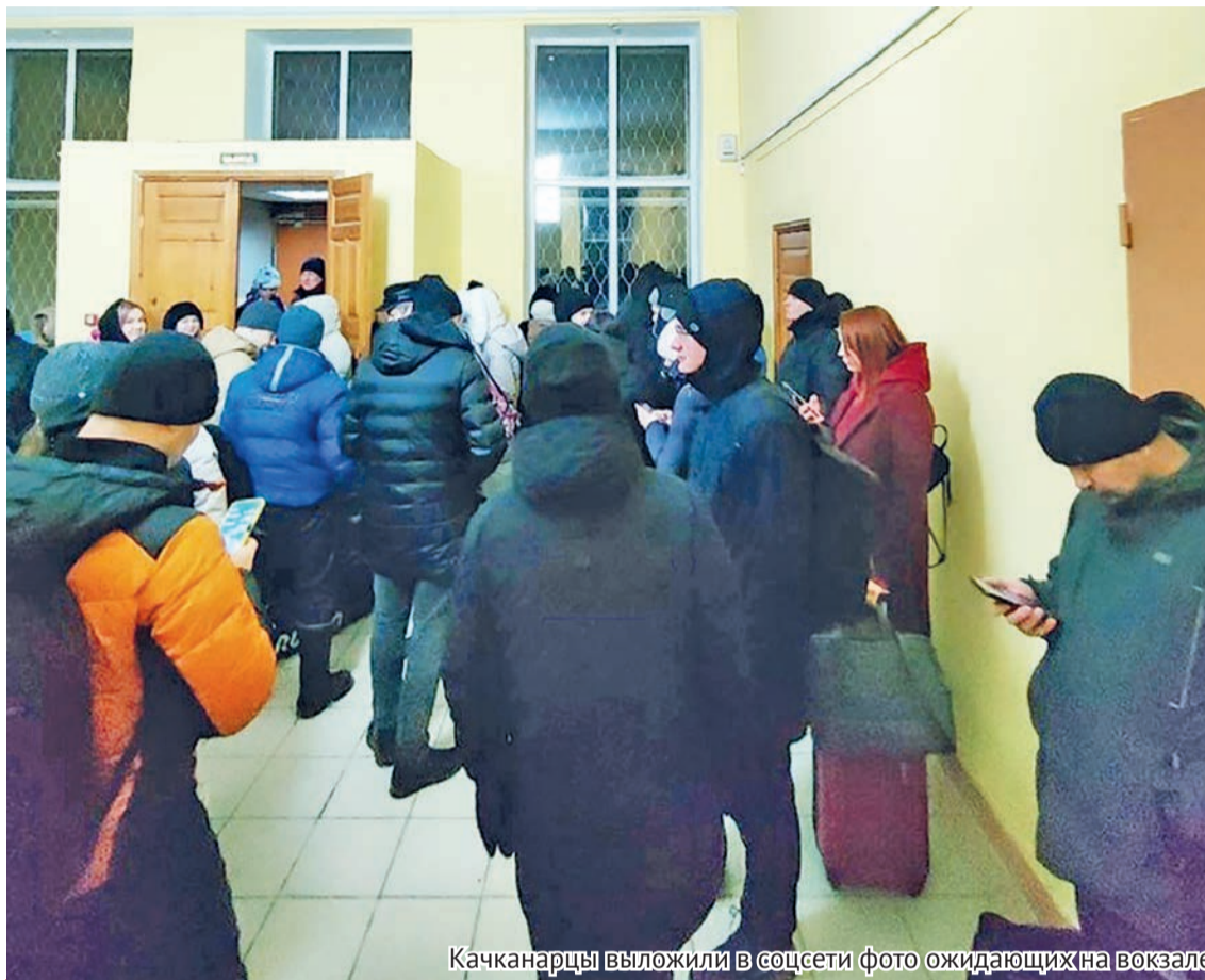
Качканарцы выложили в соцсети фото ожидающих на вокзале

Позднее в Telegram-канале Свердловской железной дороги сообщили, что движение ж/д транспорта восстановлено. Максимальная задержка электропоездов составила 2 часа 50 минут.