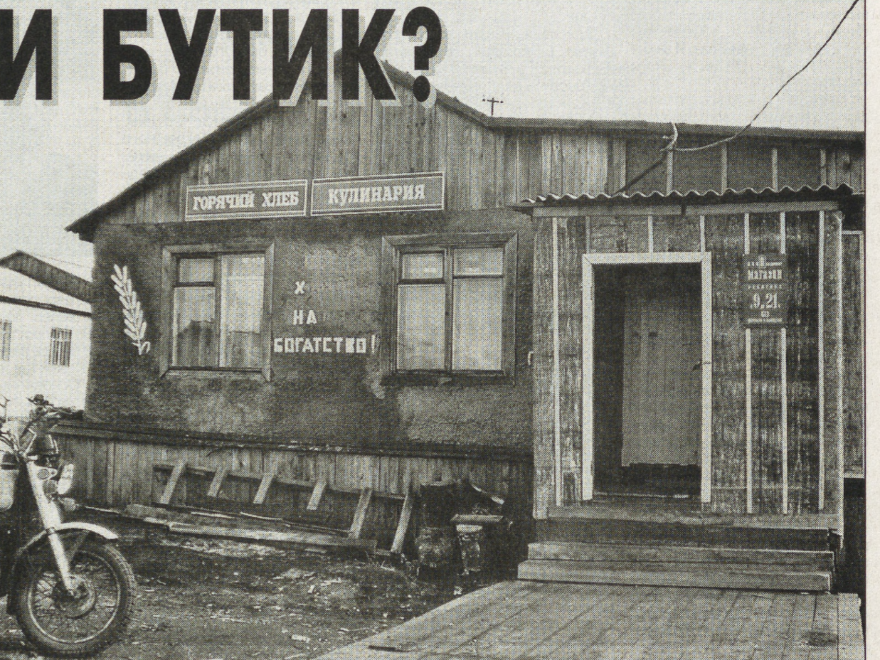
А раньше мы не верили, что хлеб - наше богатство.