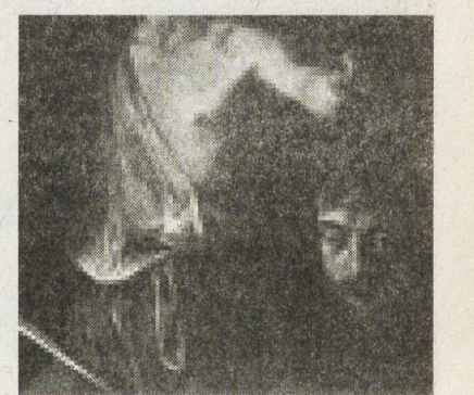
Колат, лидер турецкой общины Германии.

И тогда постановку решено было возобновить в декабре 2006 года. На спектакль намерены прийти министр внутренних дел Германии Вольфганг Шойбле, а также Кенан