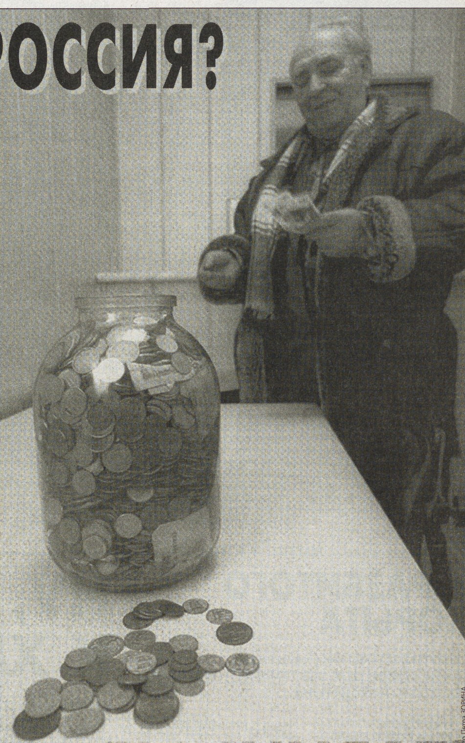
Для малоимущих россиянин самый надежный банк - стеклянный.

Рукотворно для себя и избранного круга создаются анклав с особыми видами финансирования. Вот характерный пример. Руководитель федерального агентства по культуре и кинематографии М.Швыдкой обновил декларацию о доходах на 2005 год. Как глава федерального агентства он заработал 650 тыс. 155 рублей, за чтение лекций в Российской академии театрального искусства - 19 тыс. 370