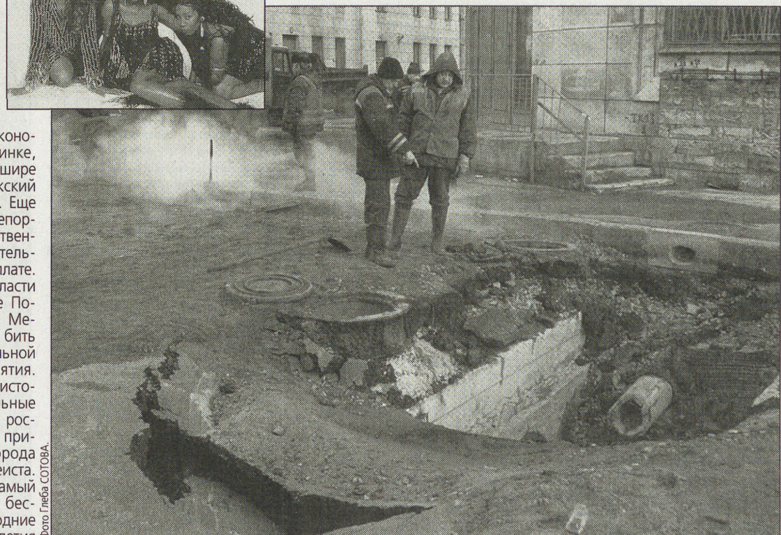
Эти «достопримечательности» артистам экзотической группы не показали.

На круг вышло, что помимо гонимых певцам пришлось потратиться на импортные усилители и прочую дорогую технику. Как выяснили костромские журналисты, список одной лишь гитары, список аппаратуры для легендарной Лиз Митчелл занимал полстраницы мелким почерком.