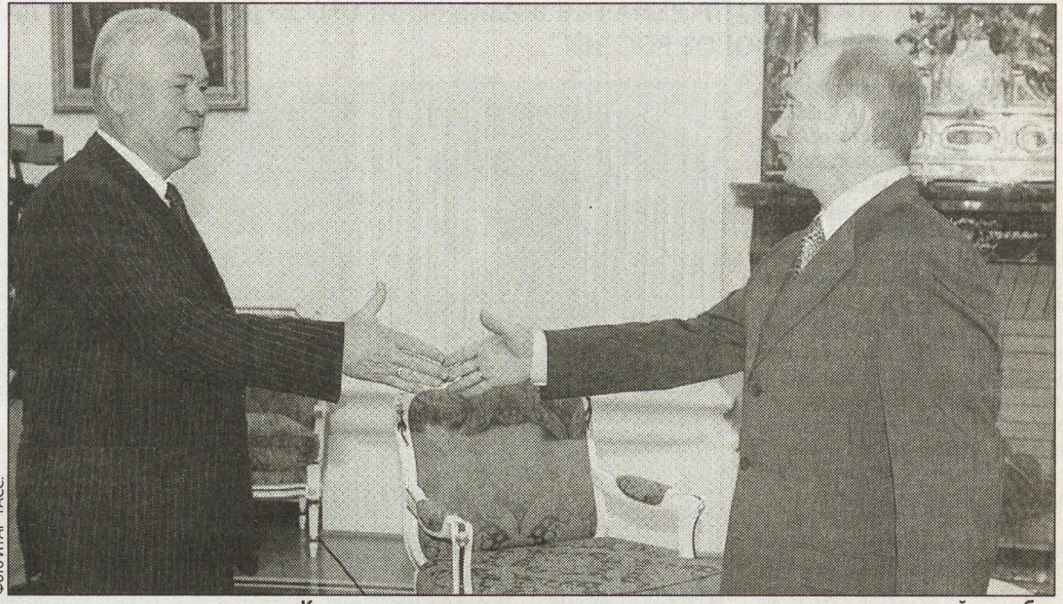
Крепкие президентские рукопожатия еще не доказательство крепкой дружбы.

МОЛДАВСКОЕ ПРАВИТЕЛЬСТВО СОБИРАЕТСЯ СУДИТЬСЯ С РОССИЕЙ