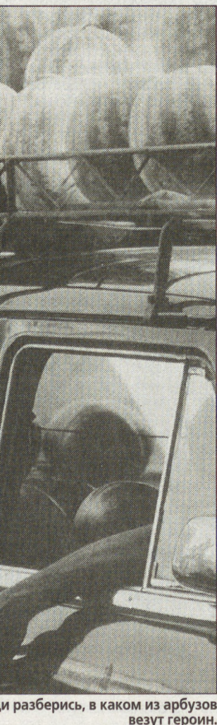
Поди разберись, в каком из арбузов везут героина.

«Гардиан»: «Московские чиновники развернули атаку на издательство Lonely Planet, заявляя, что его путеводитель для туристов изображает российскую столицу как процветающий бандитизмом город».