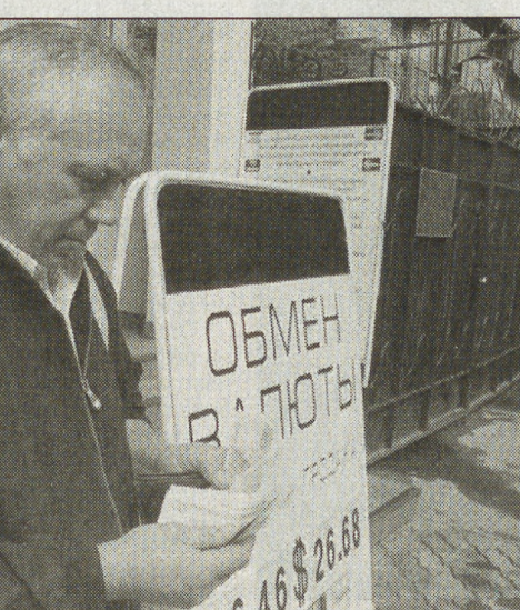
Мудро поступает тот, кто пересчитывает деньги, не отходя от обменника.