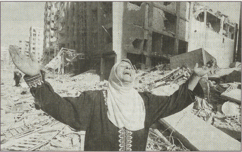
Израиль бомбит Ливан с молчаливого согласия Белого Дома.

Почти все западные, и в частности европейские, политики поддержали Израиль, будучи уверенными в том, что «Хэзболла - это серьезная проблема».