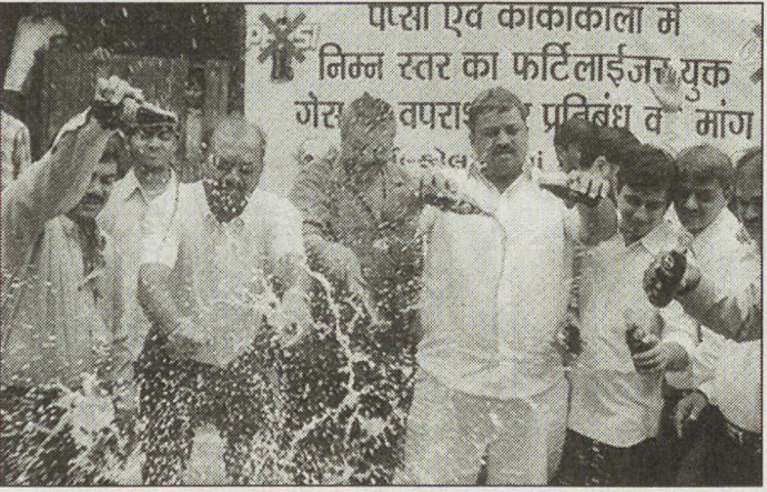
Заморскому напитку в Индии объявлена война.

Давних конкурентов - американские компании по производству прохладительных напитков Coca-Cola и PepsiCo - объединила общая беда: в Индии их обвиняют в производстве напитков с высоким содержанием вредных веществ.