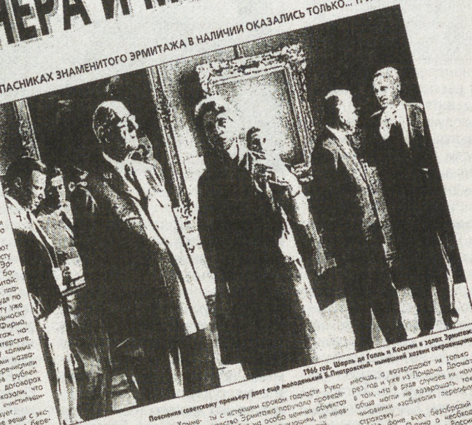
Венеры и Меркурии пропали в Эрмитаже в 1996-1998 гг. Эрмитаж. Музейная работа.

З ПЯТИДЕСЯТИ ВЫБОРОЧНО ПРОВЕРЕННЫХ ЭКСПОНАТОВ В ЗАПЯТОЧКАХ ЗНАМЕНИТОГО ЭРМИТАЖА В НАЛИЧИИ ОКАЗАЛИСЬ ТОЛЬКО... ТРИ