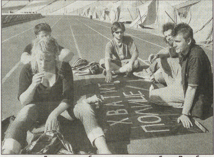
Лагерь антиглобалистов на стадионе в Санкт-Петербурге.