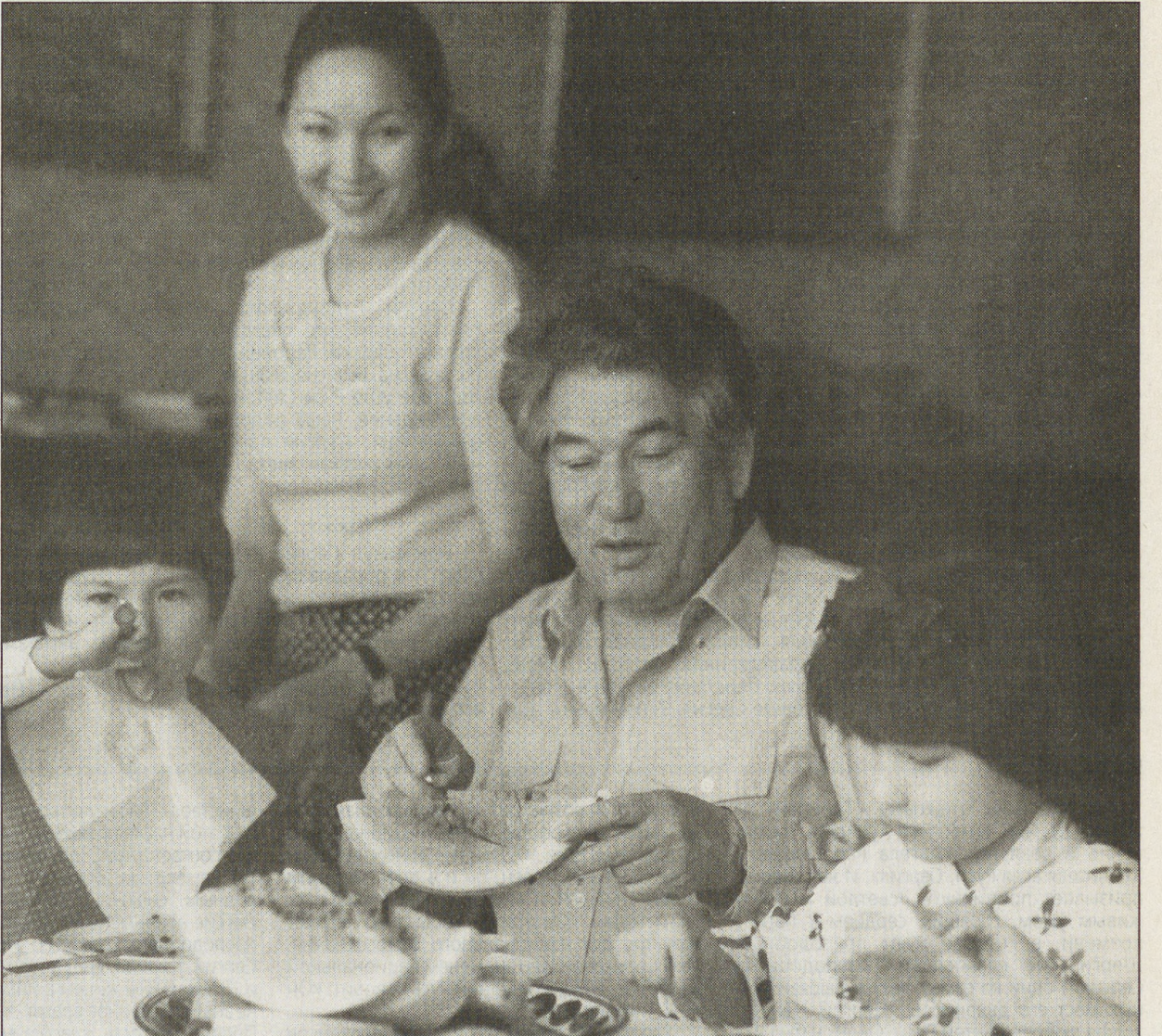
Вместе с дочерьми. Снимок 1985 г.

«А правда, что вы подтолкнули Горбачева на создание нового мышления, человека новой формации, что впоследствии вылилось в хорошо нам известные необратимые процессы?»