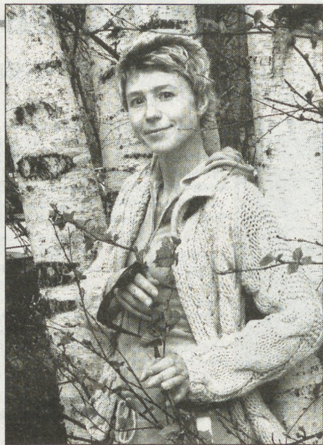
Одной из тех, кто принес Екатеринбург славу самого «спортивного» города Свердловской области и одного из самых-самых — в России, является трехкратная чемпионка мира и медалистка Олимпийских игр в Барселоне, Атланте и Афинах Ирина Лашко.

Кстати, по статистическим данным, занятиями физической культурой и спортом в настоящее время охвачены свыше 526 тысяч человек, т. е. 11,8% от общей численности населения Свердловской области. При этом в 19 муниципальных образованиях численность занимающихся значительно выше среднеобластного уровня: в Лесном, в Новоуральске, в Екатеринбурге, Нижнем Тагиле, Ивделе, Ачитском и Белоярском районах. Самый низкий процент занимающихся от численности населения в рабочем поселке Верхнее Дуброво — 3,0 процента.