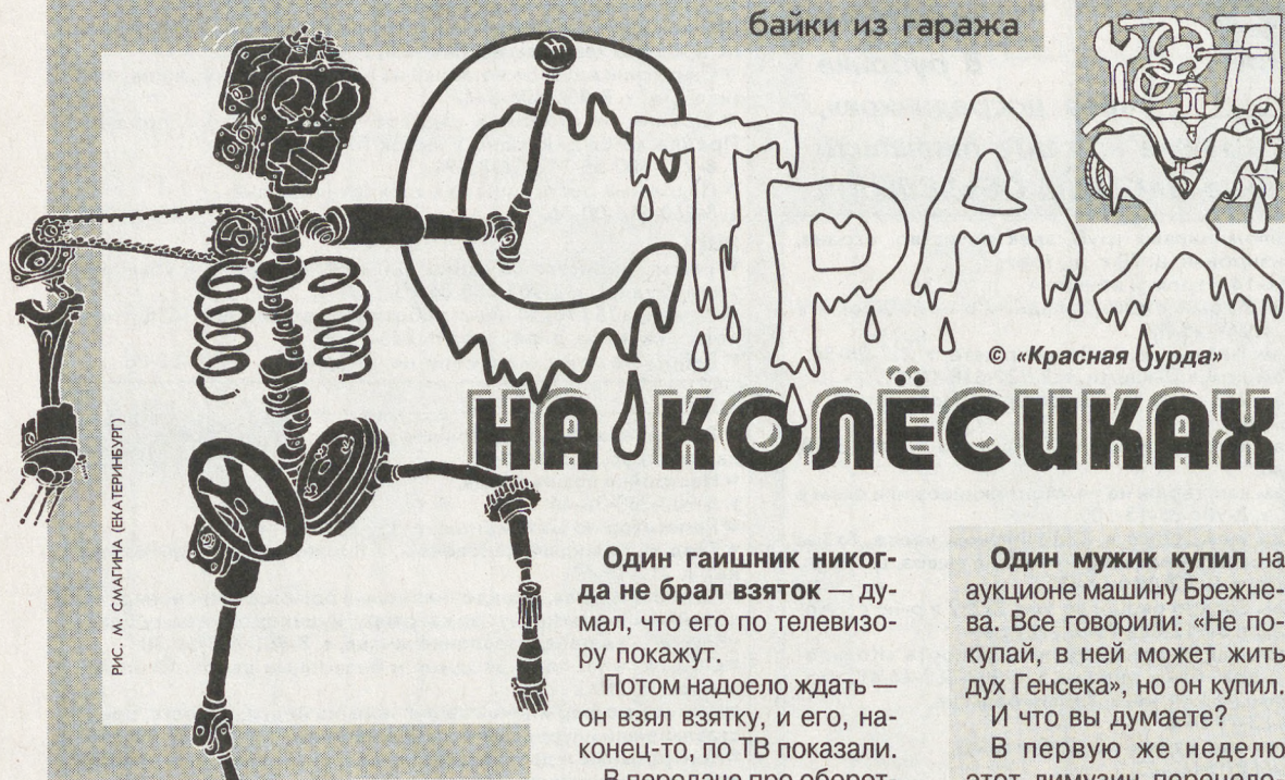
байки из гаража