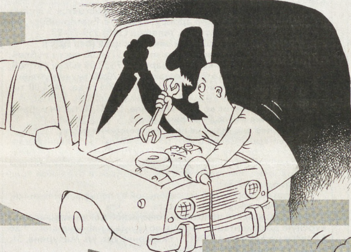
РИС. М. СЛАГИНА (БАТЕРИВУРГ)

Пришла жена на рынок, видит, что там продают как раз светло-зелёную «Оку» и как раз за 100 000 евро. Забыла жена про всё, что говорил ей муж, и полезла в сумочку за деньгами. Хватя, а денег-то и нету. Украли.