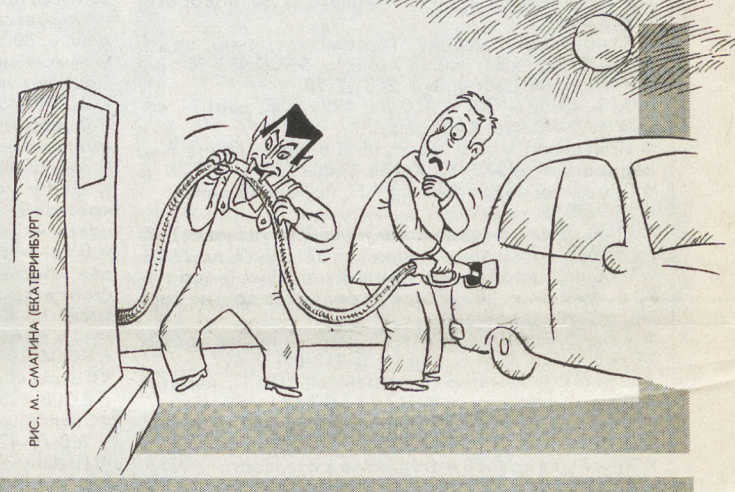
РИС. М. СЛАГИНА (БАТЕРИВУРГ)

Мужик тогда поехал в милицию, всё про старух рассказал, а уж оттуда его в дурдом-то и свезли.