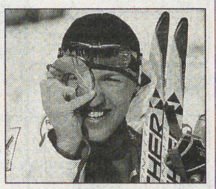
Лыжник Евгений Дементьев

Такого, каким был, например, американец Эрик Хайден, или норвежец Оле-Эйнар Бьорндален, или лыжник из этой же страны — Бьорн Дели. Судите сами, Хайден выиграл на Играх в Лейк-Плэсиде пять золотых наград — ровно столько же, сколько и вся сборная России в Солт-Лейк-Сити.