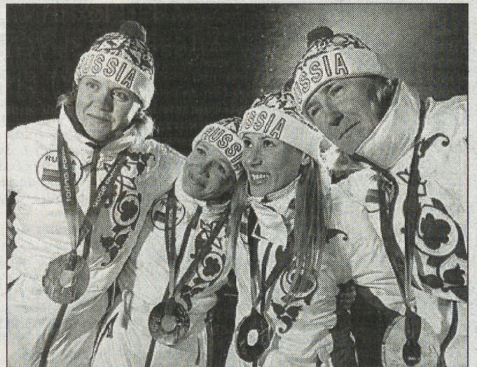
Команда лыжниц привезли из Турина олимпийское «золото»