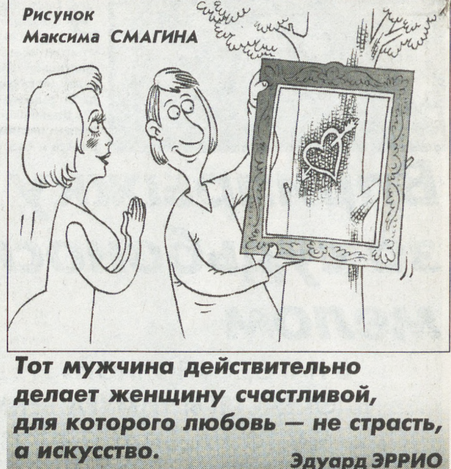
Тот мужчина действительно делает женщину счастливой, для которого любовь — не страсть, а искусство. Эдуард ЭРРИО