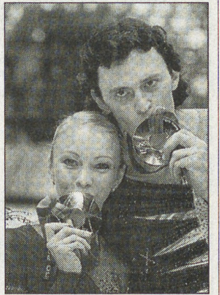
Фигуристы Татьяна Тотьмянина и Максим Маринин

Бесспорно, хорошо, что в Турине наш «ассортимент» хоть немного расширился. В него вернулся конькобежный спорт, а также добавились сани и бобслей. Это и есть главное наше достижение Турина-2006, а вовсе не позиция в «табели о рангах», какой бы высокой она ни была. Медали нынче выигрывают все: помимо традиционных