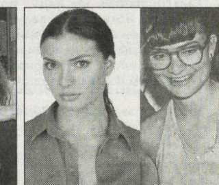
Александра Нелдел («Влюблена в Берлине», Германия)