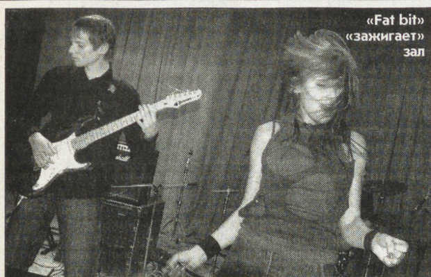
«Fat bit» «зажигает» зал