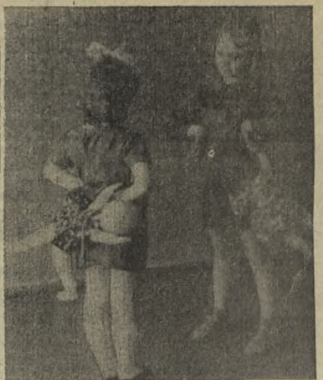
Этюд «Русский танец»

Лица, виновные в нарушении решения, будут наказываться административной комиссией в установленном порядке.