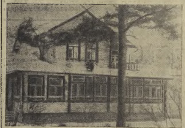
Поселок Репино (б. Куоккала). Дача «Ваза», где жил В. И. Ленин в 1906 — 1907 г.г.