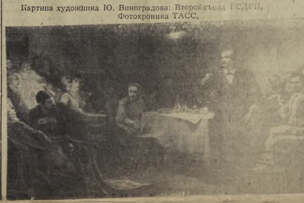
Картина художника Ю. Виноградова: Второй съезд РСДРП.