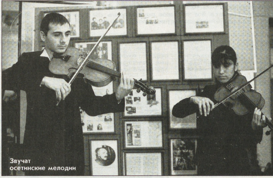
Звучат осетинские мелодии