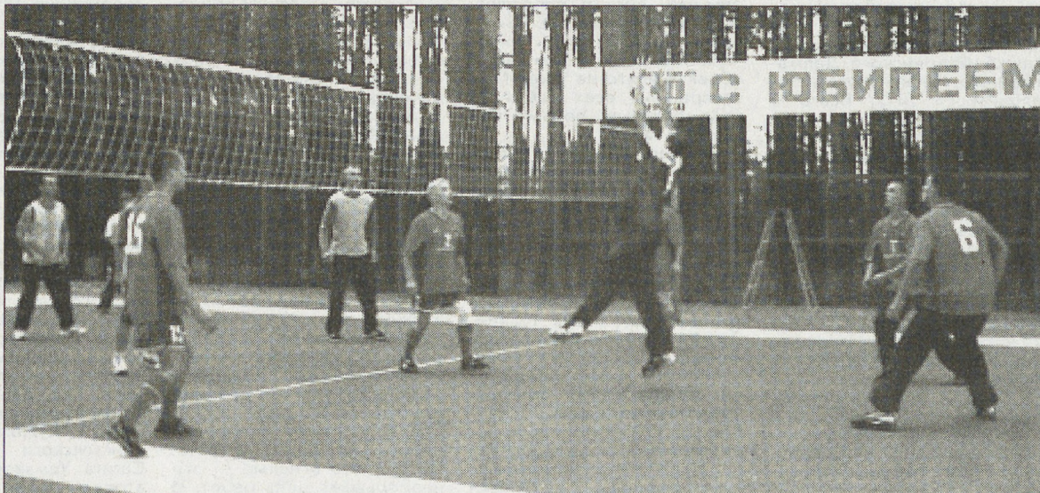
Команда МИЛПУ выходит на волейбольную площадку