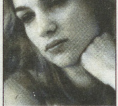
Подборка Юрия ОВОВОДА

Результаты партий 3—4-го туров: Половникова (Киров) — Галлямова (Казань) — 0:1, Скрипенко — Чибурданидзе (Грузия) — 1:0, Ковалевская (Ростов-на-Дону) — Курсова (Екатеринбург) — 1:0, Жукова (Украина) — Половникова — 0:1, Матвеева (Москва) — Ковалевская — 0:1, Жукова — Стефанова (Болгария), Краш (США) — Матвеева, Галлямова — Скрипенко, Чибурданидзе — Краш, Стефанова — Курсова —