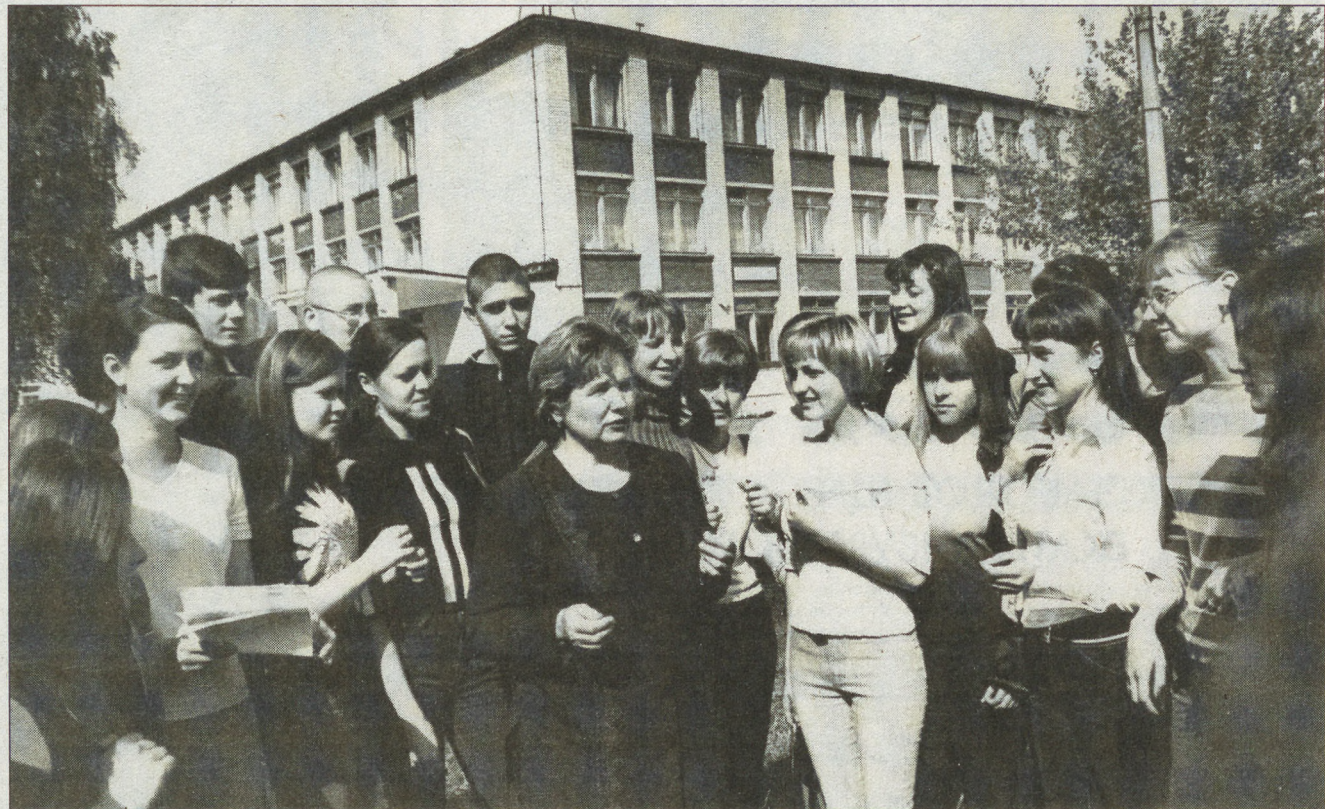
КРАСНАЯ И БЕЛАЯ — ВСЕ ЕДИНО

При поддержке города в школе №141 работает экокафе «Оазис здоровья»: во-первых, продукцию для