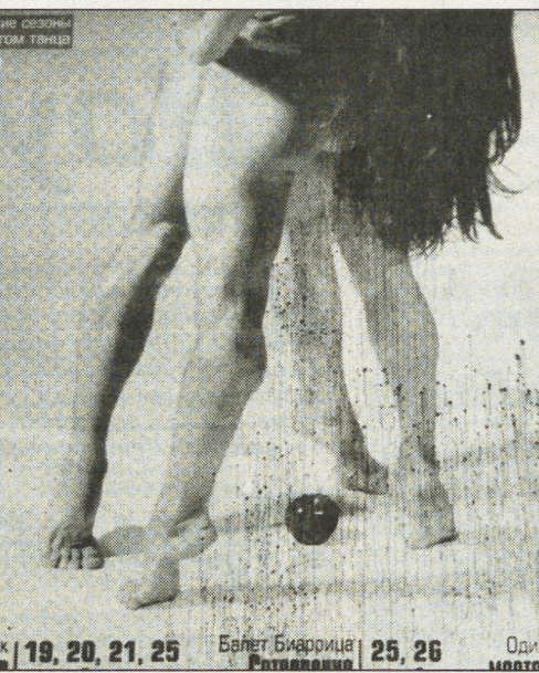
19, 20, 21, 25 Балет Екатеринбург 25, 26 Оди

Пал Френак вырос в семье глухонемых и не привык изъясняться вербально. Он считает, что не все можно выразить словами: «В своих спектаклях я пытаюсь объяснить что-то сущностное языком тела. Танец передает определенный смысл. Для меня нет ничего конкретного. Единственное, что я могу вам сказать, — речь всегда идет о внутреннем состоянии человека, о чувствах. Мне жаль вас разочаровывать, но я не могу объяснить те вещи, которые вы должны понять, прочувствовать сами». В Екатеринбурге Френак поставил новый спектакль «Спиной к стене» со студентами Института танца. «Русские хотят работать. Они часто спрашивают меня, хорошо или плохо у них получается. Но я не могу ответить, в моих спектаклях таких оценок нет. В движениях танцовщиков я ценю прежде всего простоту, естественность. Для меня важно передать зрителью мои чувства, заставить его увидеть то, что вижу я». На пресс-конференции Пала Френака в Уральском университете имени Горького студенты увидели на видео отрывки из двух его спектаклей: «Трик-Трак», который завоевал награды на различных международных конкурсах (его жители нашего города уже имели возможность посмотреть в 2001 году), и «Хаос». Премьера спектакля «Спиной к стене» состоялась в сентябре. Зрительный зал был полон. На спектакли француз за, видимо, ходят только его поклонники, потому что всем зрителям представление очень понравилось. Пал Френак — на самом деле великий